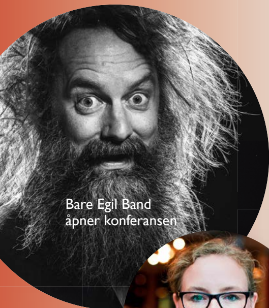
Bare Egil Band åpner konferansen